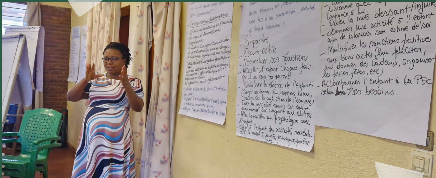
Training in Bujumbura: Die Weiterbildungen helfen nicht nur den betroffenen Kindern, sondern stärken auch die Gemeinschaften, in denen sie leben.