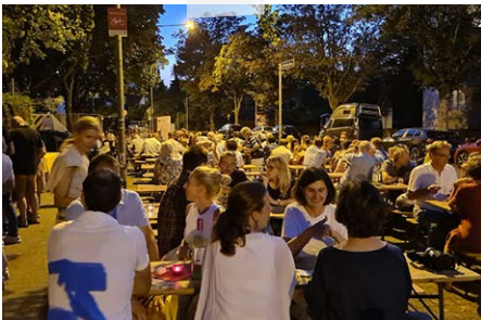
In vino caritas: Gespendet werden konnte je nach Wunsch und Durst.

Ein herzliches Dankeschön an Familie Wegner-Druschke und alle, die dabei waren!