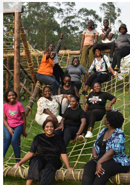
Gut vernetzt: das Team von UWONET bei einer Schulung zu Stressbewältigung und Resilienz.

Dank der Förderung konnte UWONET wichtige Massnahmen umsetzen. Das Netzwerk organisierte Treffen mit dem Ministerium für Gender, Arbeit und soziale Entwicklung – zu Themen wie Gewalt gegen Frauen, Gesetzesreformen und wirtschaftlicher Stärkung von Frauen. In Zeiten, in denen Frauenrechte unter Druck geraten, sind solche Treffen entscheidend, um den Dialog aufrechtzuerhalten und Veränderungen voranzutreiben.