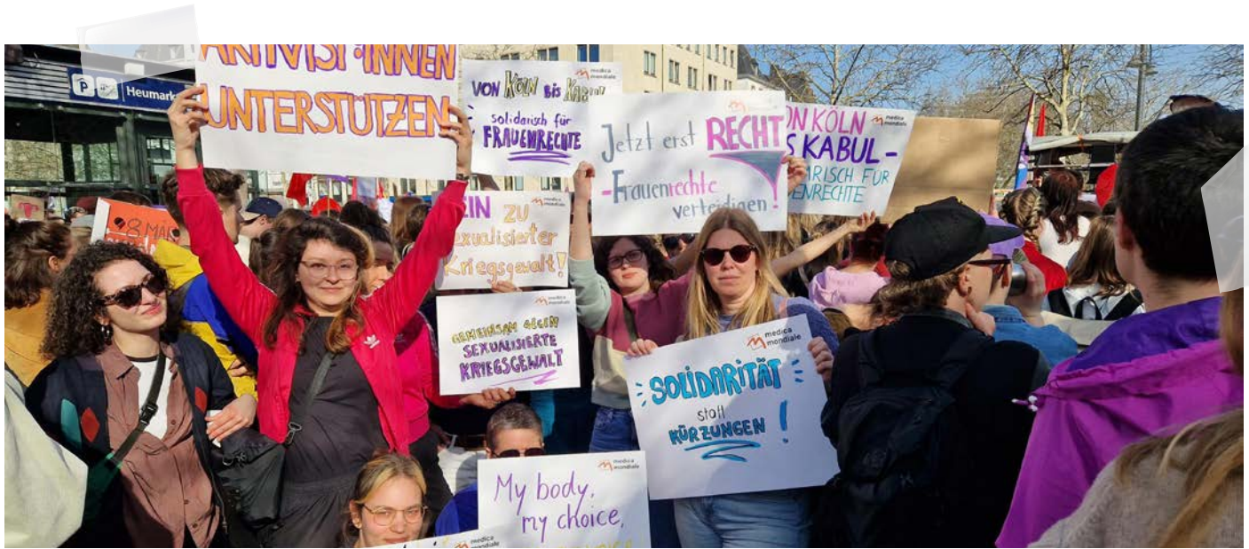
Mitarbeiter:innen von medica mondiale bei der Demonstration zum 8. März 2026 am Heumarkt in Köln.