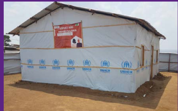
„Mahali Salama“ heisst das Zentrum von medica mondiale und ihrer burundischen Partnerorganisation AST. Zu Deutsch: Sicherer Ort.