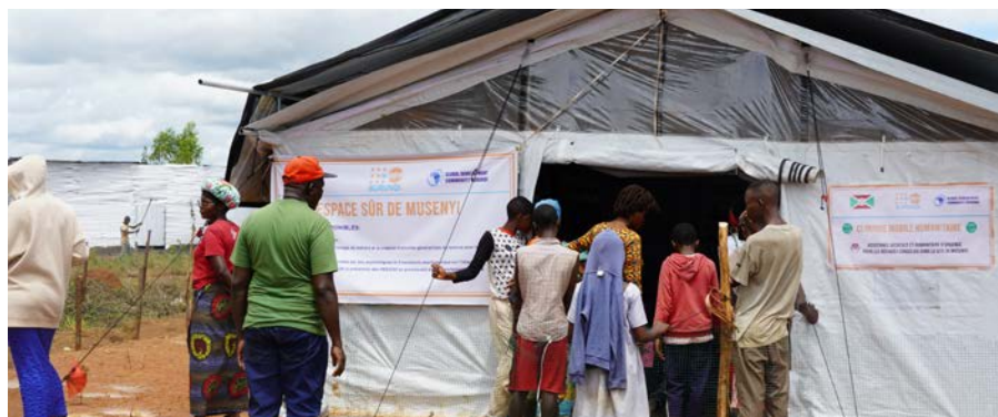
Im Geflüchtetenlager Musenyi stärkt medica mondiale geflüchtete Frauen und Mädchen durch psychosoziale Angebote.