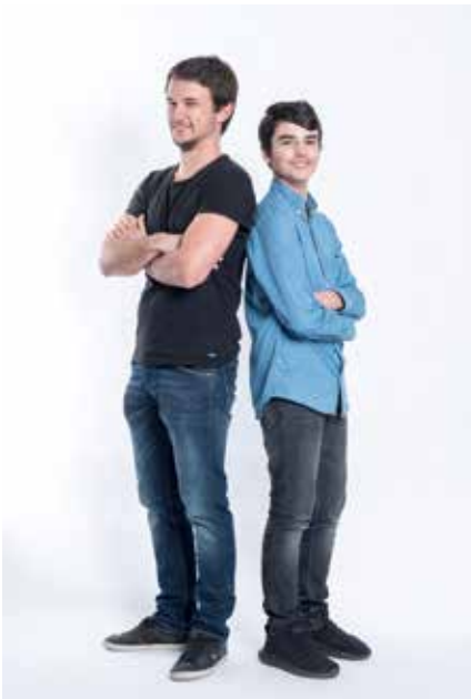
Mentore begleiten Jugendliche

Für diese tafelpost haben wir mit ROCK YOUR LIFE! zusammengearbeitet, damit Sie, liebe Leserinnen und Leser, Chancen vergeben können. Führen Sie ein Unternehmen? Kennen Sie einflussreiche Leute? Wollen Sie einem jungen Menschen Türen öffnen?