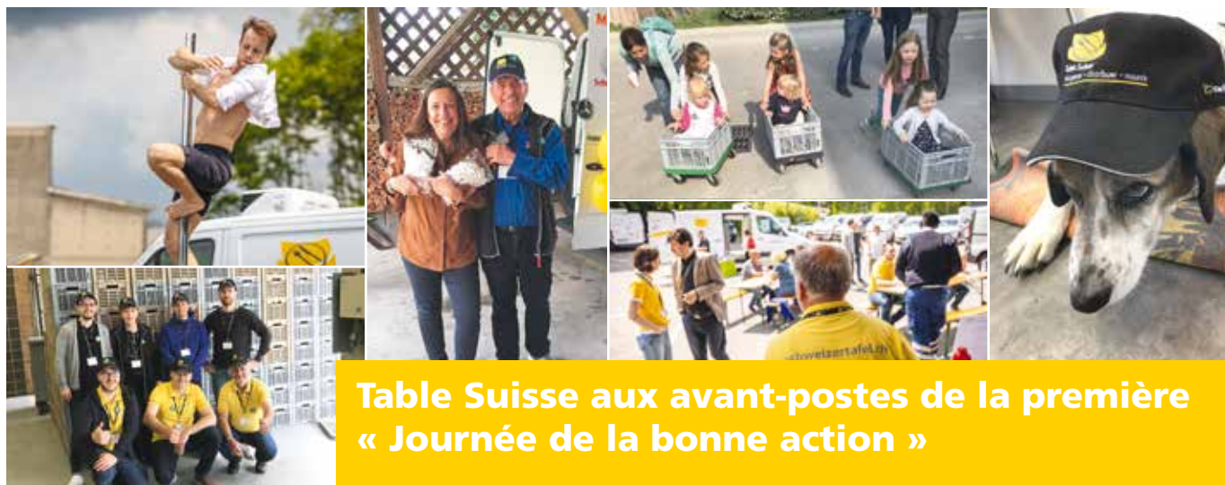
Table Suisse aux avant-postes de la première « Journée de la bonne action »

Dans le cadre de sa campagne « Des paroles aux actes », Coop a lancé le 25 mai 2019 une « Journée de la bonne action », invitant collaborateurs, partenaires et clients à profiter de cette journée pour faire une bonne action. Pour multiplier l'effet de la journée, cinq organisations ont été choisies pour être les partenaires de cette première édition. Et parmi elles, Table Suisse. Avec notre action « Un panier de plus », nous avons récolté des dons d'aliments apportés par la population et avons profité de l'occasion pour organiser une journée portes ouvertes placée sous le signe de la famille.