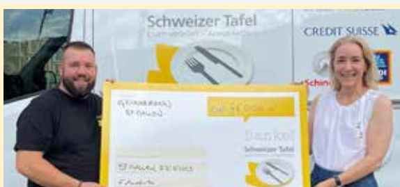
Präsidentin: Flavia Ludin Ostschweiz: 48 000 Franken